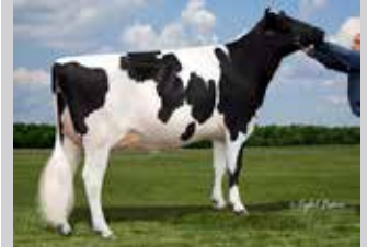
CEDARWAL SUPERSIRE LADYBUG Madre