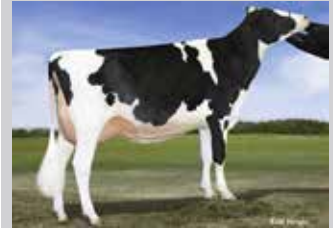
MISTY SPRINGS M O M SERAPHYNE Abuela Materna