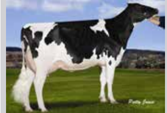
MS CHASSITY OBS CLAIRE-ET Madre