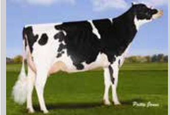
COOKIECUTTER MOM HUE-ET Abuela paterna