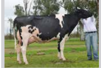
GAJC LATINA SHOTLE LICORICE Madre